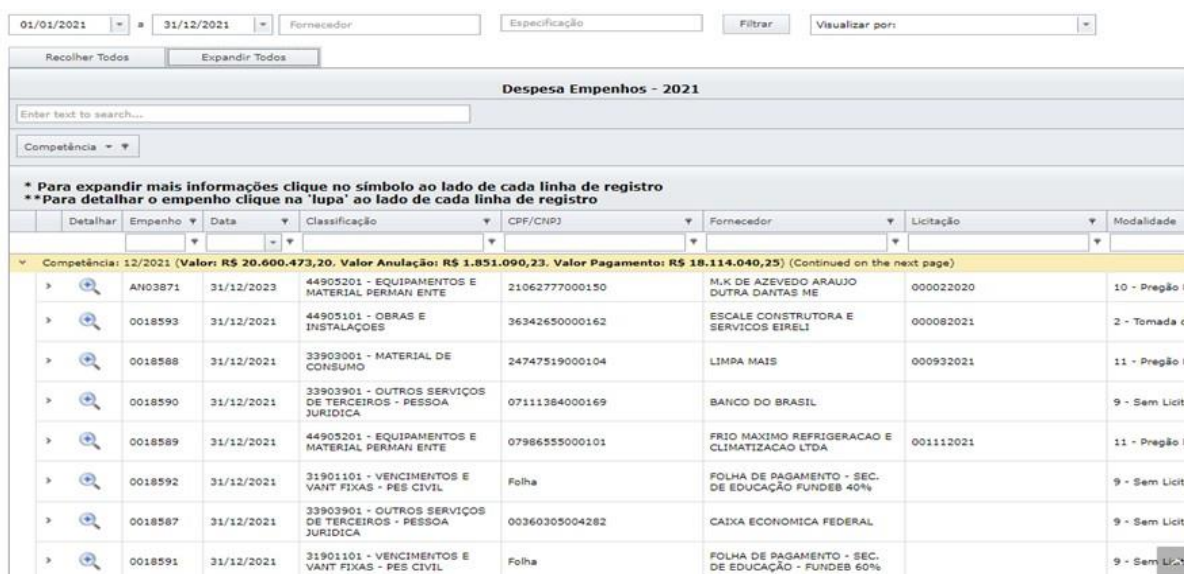
Figura 10 – Detalhamento das Despesas Empenhos