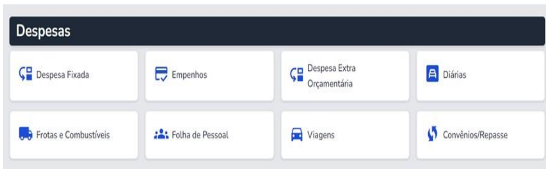
Figura 6 – Opções de consultas das despesas